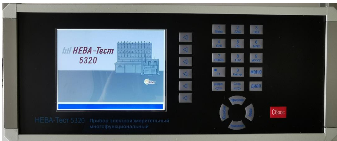
Рисунок 1 – Лицевая панель прибора электроизмерительного многофункционального HEBA-Тест 5320