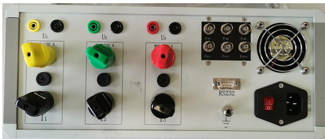
Рисунок 2 – Задняя панель прибора электроизмерительного многофункционального HEBA-Тест 5320